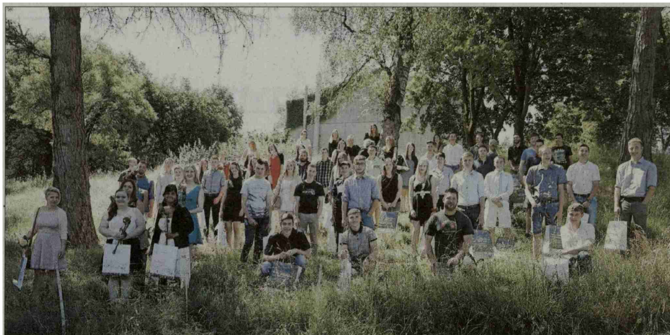
Ambiance bucolique pour cette remise de diplômes inhabituelle de la Fondation rurale interjurassienne, mercredi à Courtemelon.