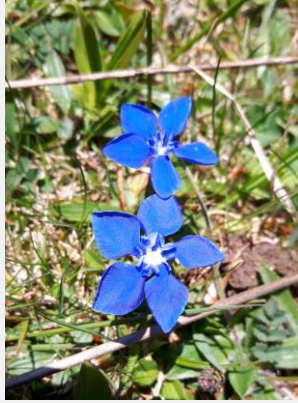
Gentianes printanières (Parc du Doubs)

079 833 61 03 / viviane.froidevaux@parcdoubs.ch