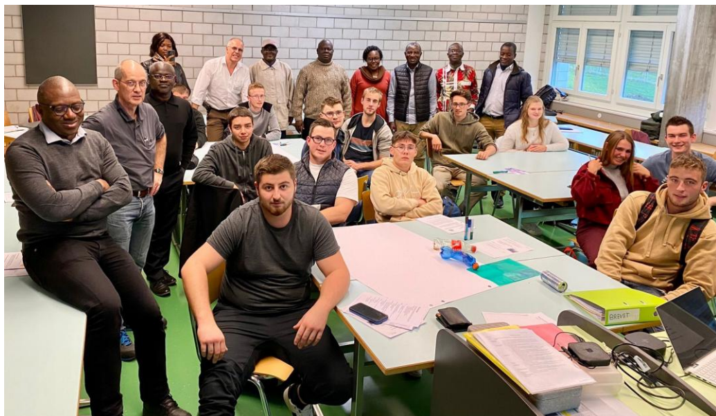
Photo : Brevet fédéral de chef d'exploitation (développement des compétences d'entrepreneurs, archives 2023)