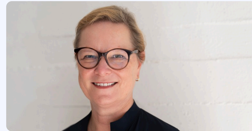
Marina Helm Marketing et marketing direct