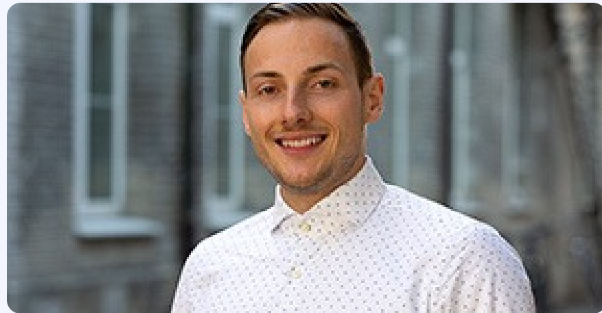
Tombe de Lucas Numérisation